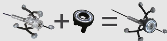
Centreur Type-B avec éclairage