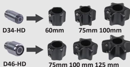
D34-HD 60mm 75mm 100mm