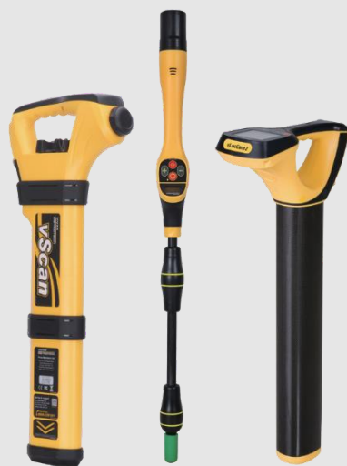
vScan, VM-540, vLocCam2: détecteurs Sondes

(1) L'unité de contrôle possède un écran HD (« haute définition ») et est totalement fonctionnel lorsqu'il est utilisé avec les caméras D34-HD et D46-HD. L'unité vCam-6 est compatible avec les caméras D18-MX, D26-MX, D34-C, D34-M, and D46-CP des vCam Mx et vCam5 mais ne produiront que des images SD (« définition standard »).